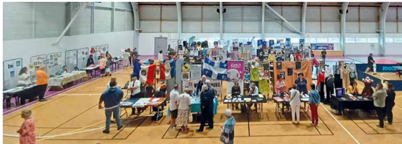
Forum des associations 2025

E-mail : assolettoilesdepatassy@gmail.com